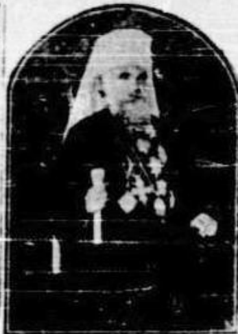
I. P. S. S. Patriarhul Miron Cristea Președ. Consiliului de Miniștri

E o unire înăptioasă datorită „Frontului Renașterii Naționale”, unicul organism politic al țării, care a întrunit adevăratele tuturor cetățenilor, atât ale românilor de sânge, cât și ale minorităților.